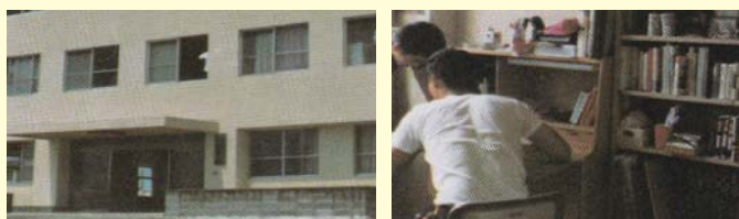
(学生寮案内・・・当時の学生生活の様子がうかがえます。)

当時は入口から入ってすぐに喫食スペースとなっていました。 テーブルの上の赤い缶は吸い殻入れでした。