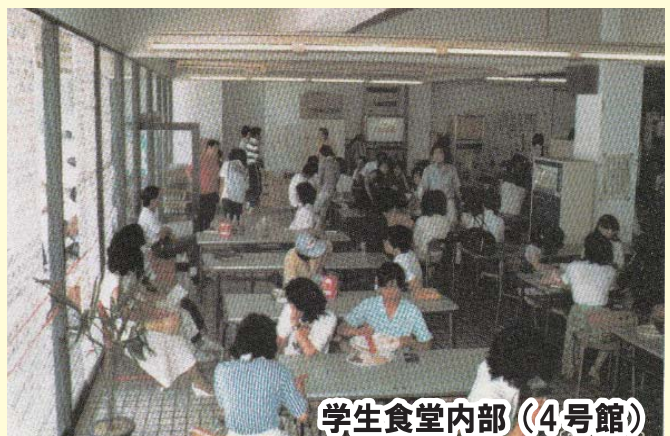
学生食堂内部(4号館)

当時は入口から入ってすぐに喫食スペースとなっていました。 テーブルの上の赤い缶は吸い殻入れでした。