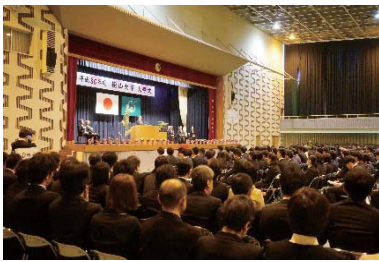
大学記念館にて開催

式の締めくくりとして校歌斉唱が行われ、厳粛な中終了しました。このあと、校友会の協賛により、学生食堂では桜を愛でながらのお茶席、学生食堂前では歓迎も餅まきが行われ、好天の中、学内は歓迎ムードに溢れました。