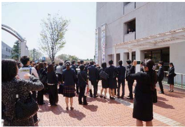
学食前盛り上がる餅まき