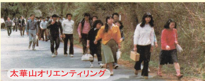
太華山オリエンティング